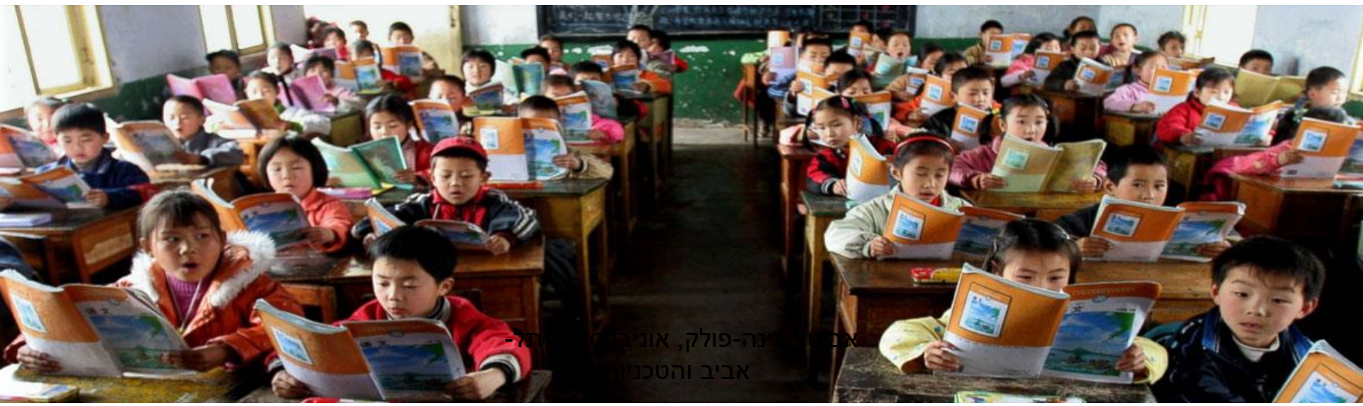
אסטרטגיה פולק, אוניברסיטת אביב והטכניון