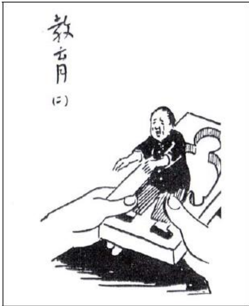
"Education 2" by Feng Zikai, 1932.