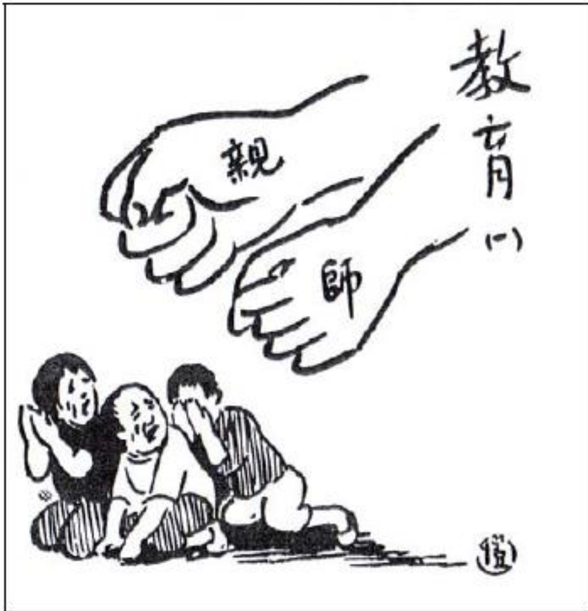
"Education 1" by Feng Zikai, 1932.