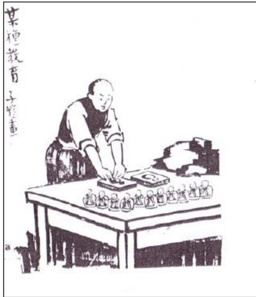
"A Certain Kind of Education" by Feng Zikai, 1942?